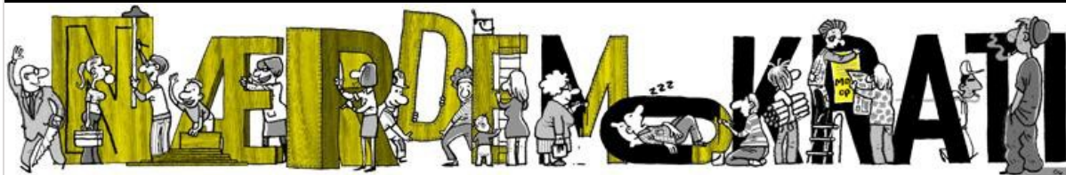
Illustration: Gitte Skov

Nyhedsmagasinet Danske Kommuner nr. 31 / 2012